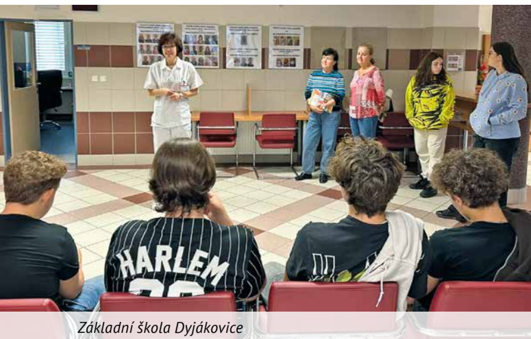
Základní škola Dyjákovice

Žáci z Prosiměřic a Dyjákovic odcházeli ze znojemské nemocnice nejen s nově nabytými informacemi, ale především s pocitem, že si mohou vybrat cestu, která je osobně naplní a zároveň přinese užitek ostatním. Díky tomuto setkání mají žáci daleko jasnější představu o tom, co obnáší práce zdravotnického personálu, a možná se někteří z nich jednoho dne vrátí do chodeb znojemské nemocnice jako kolegové těch, kteří je nyní inspirovali.