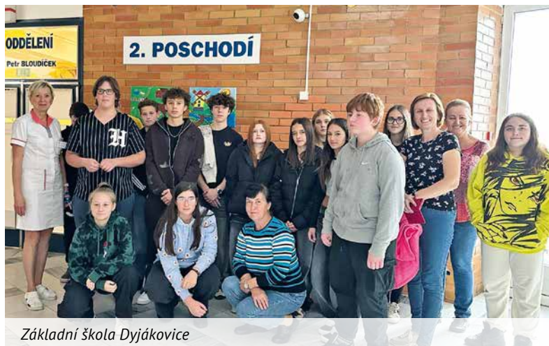
Základní škola Dyjákovice