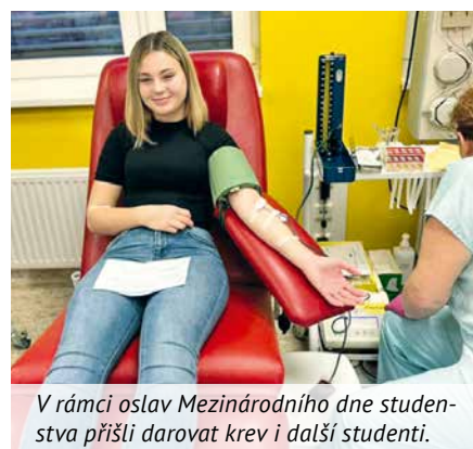
V rámci oslav Mezinárodního dne studentstva přišli darovat krev i další studenti.

Listopadová oslava Mezinárodního dne studentstva se nesla v podobném duchu, kdy se k darování krve připojili studenti a učite-