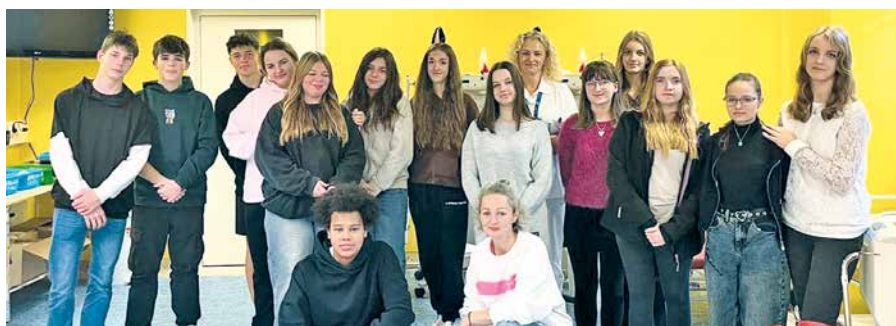
Žáci ZŠ Kravsko při návštěvě hematologicko-transfuzního oddělení.

Hematologicko-transfuzní oddělení ve spolupráci s Oblastním spolkem Českého červeného kříže Znojmo pořádá také pravidelná setkání se studenty Střední školy technické Znojmo – Uhlárky. Tato setkání mají za cíl přiblížit mladým lidem význam a nenahraditelnou hodnotu darování krve. Díky této iniciativě se podařilo dosáhnout skvělých výsledků – mnoho studentů i učitelů se stalo pravidelnými dárci krve.