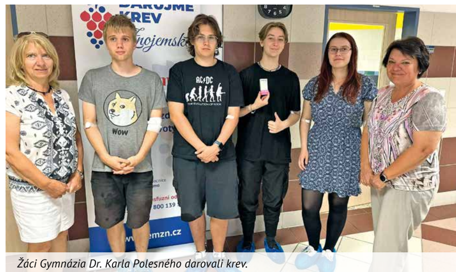
Žáci Gymnázia Dr. Karla Polesného darovali krev.

lé dalších škol. Tradičně největší zastoupení měli studenti Střední zdravotnické školy a vyšší odborné školy zdravotnické Znojmo a Střední školy technické Znojmo - Uhlárky. Zastoupení měli i vysokoškoláci z Brna. Dárci byli odměněni drobnými dárky od partnerů akce, mezi které patřily společnosti Bylinky.cz, Vojenská zdravotní pojišťovna ČR a Česká průmyslová zdravotní pojišťovna.