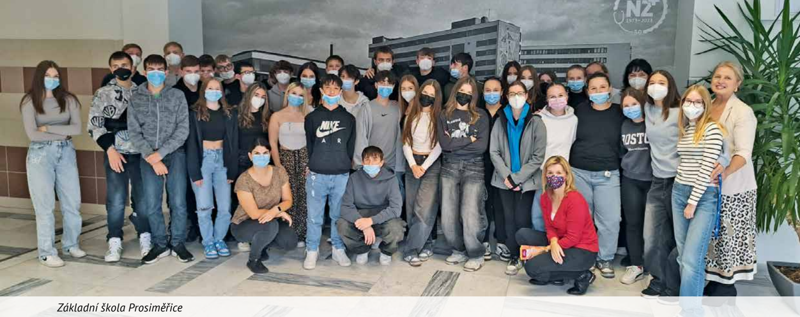
Základní škola Prosiměřice